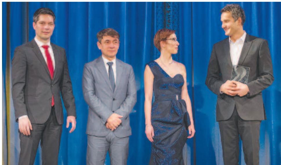
A díjátadó gálán

Bár a beszélgetésre készülve igencsak furdalt a kíváncsiság, hogy a legkülönbözőbb területeken dolgozó 80 pályázóból kiválasztott 30 felvidéki, délvidéki, kárpátaljai és erdélyi vállalkozó közül hogyan lehet az élre kerülni, néhány mondat után szinte fölöslegesnek tartottam a kérdést. A velem szemben ülő, megjelenésében is megnyerő, sokoldalú, művelt, a szaknyelvet magyarul is kiválóan beszélő