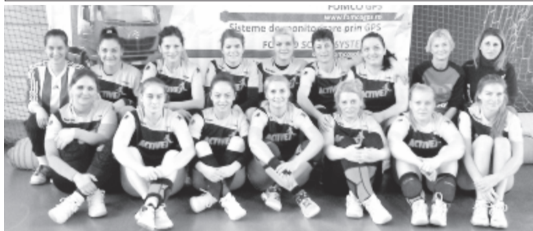
A marosvásárhelyi csapat