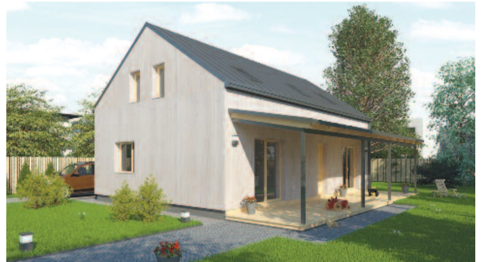
A négy típusház egyike

2002-07 között jártam ki a kolozsvári Műszaki Egyetem Építőmérnöki Karát. Az egyetemi évek alatt eladási ügynökként, majd marketingesként egy irodaszékeket gyártó cégnél dolgoztam.