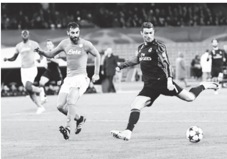
Cristiano Ronaldo (j) közel állt a gólszerzéshez, azonban tisztá helyzetben a kapufát találta el.

A negyeddöntő sorsolását jövő pénteken rendezik.